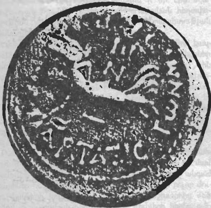
سکه شهری آرتاشاد (سال ۱۸۳ پ. م.)

آنان تشسته اند. همچنین ماهی ها، ماهی گیران و خدایان عشق و زناشویی یونان به تصویر کشیده شده اند. در نقاشی موزائیک گارنی که متعلق به سده سوم است، در کنار نگاره ها نوشته هایی به زبان یونانی نیز وجود دارد. در این دوره هنر ارمنی با اتکا بر سنن محلی و با تأثیر پذیری از هنر هلنیستی پیشرفت شایان توجهی کرد.