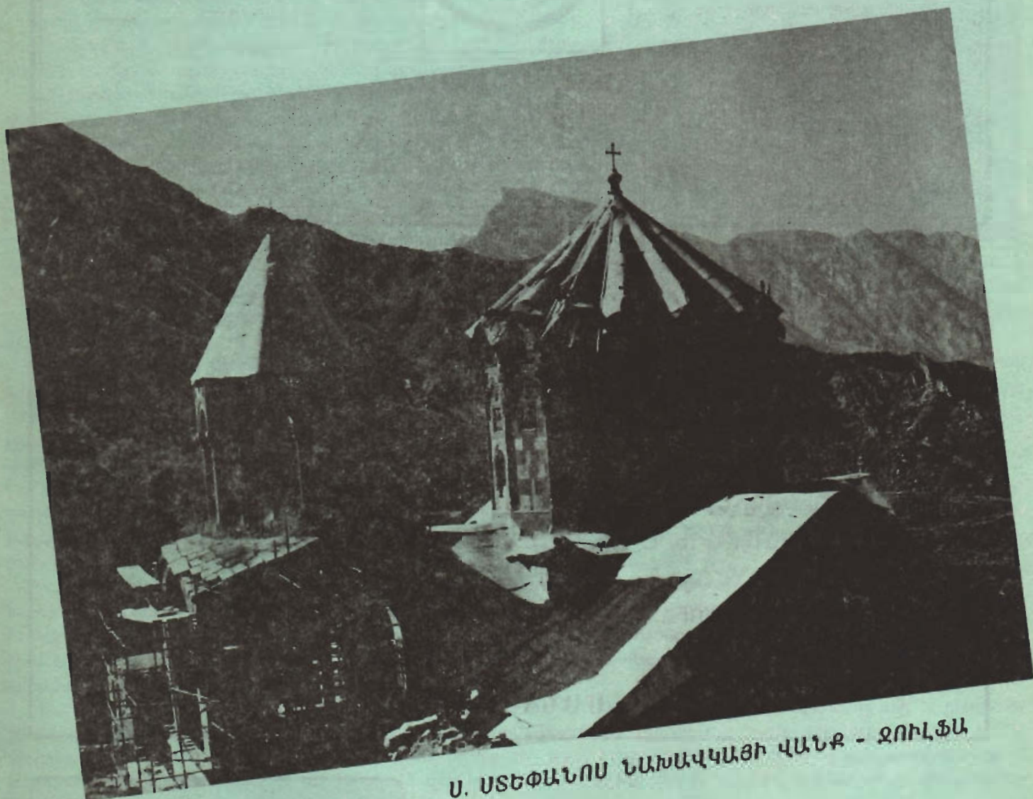
Ս. ՍՏԵՓԱՆՈՍ ՆԱԽԱՎԿԱՅԻ ՎԱՆՔ - ԶՈՒԼՖԱ

فرهنگی، اجتماعی، ادبی سال یازدهم شماره 81 تیرماه ۱۳۷۶ تک شماره ۱۰۰۰ ریال