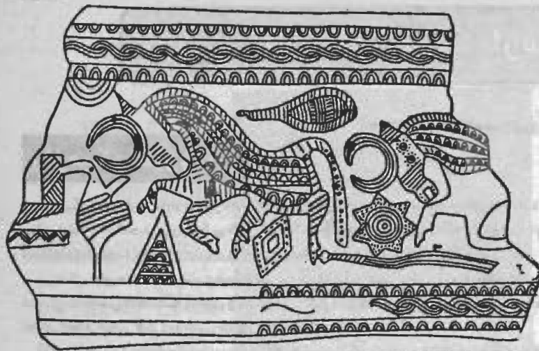
یک تکه از کمر بند مغربی - قره باغ کوهستانی